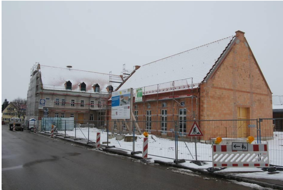
Brauereigaststätte mit Bürgersaalanbau in der Bau- und Sanierungsphase