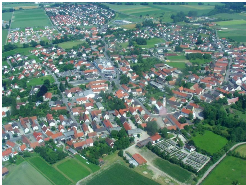
Ortszentrum Mertingen