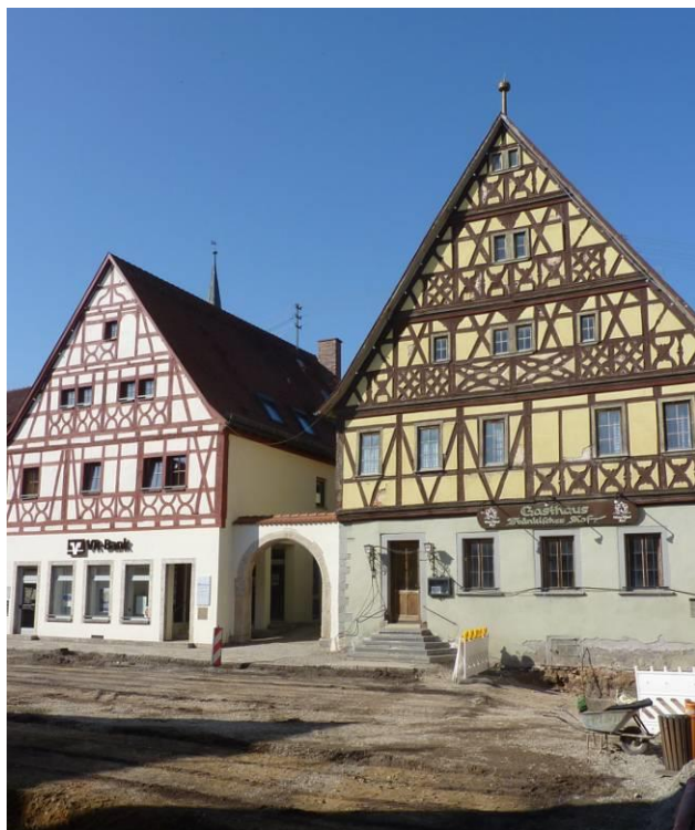
Marktplatz-Umgestaltung am Leerstand „Fränkischer Hof“