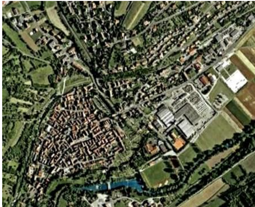
Siedlungsstruktur der Stadt Röttingen