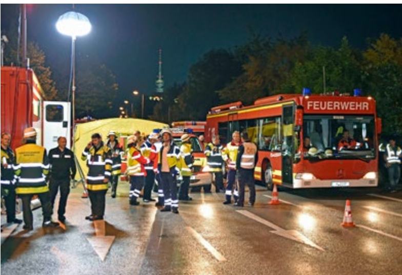
Standort der Örtlichen Einsatzleitung.

vor Ort verunsicherten die eingesetzten Einsatzkräfte und erschwerten die rasche Abarbeitung der Einsatzaufträge.