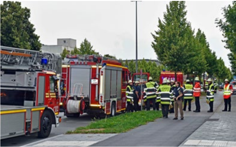
Bereitstellung von Einsatzfahrzeugen der Feuerwehr an einem Abrufplatz im Bereich des OEZ.

15 BayKatSG festgestellt und die Funktion des Örtlichen Einsatzleiters übernommen.