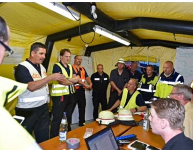
Lagebesprechung der Örtlichen Einsatzleitung.

Um für diesen Fall bei einer weiteren Eskalation der Lage vor Ort aber auch für weitere nicht auszuschließende Anschlagseignisse an anderen Örtlichkeiten im Stadtgebiet