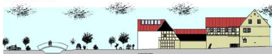
Planung Schuhmacherhaus © Arch. Bergmann, Hofheim