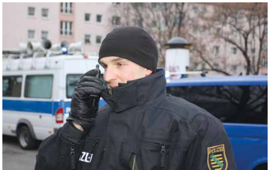
Mit dem Digitalfunk BOS im Einsatz

- Die sogenannte Review-Studie, soll begutachten, ob die bereits vorliegenden Forschungsergebnisse aus benachbartem Hochfrequenzbereich (z.B. GSM, UMTS) auf den Digitalfunk BOS übertragen werden können. Diese Studie wird voraussichtlich im Jahr 2015 fertiggestellt.