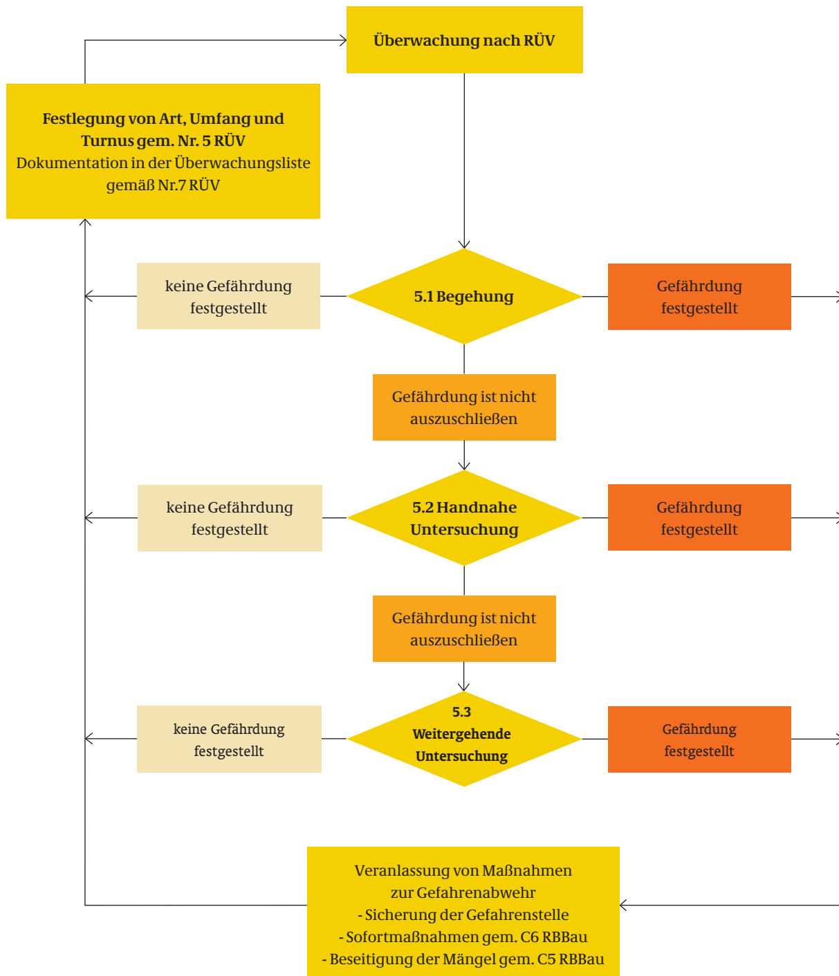
Abb. 2: Flussdiagramm zur graphischen Darstellung der Überwachung

Die Beauftragung und Begleitung erfolgt durch die Bauverwaltung.